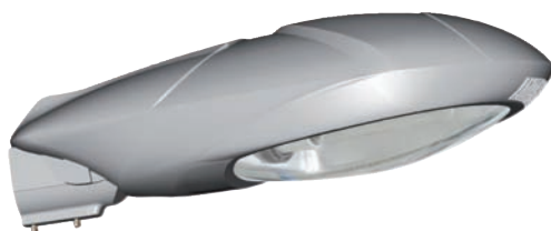
Mastaufsatz 42-60'er Zopf b-lite® kompakt 600