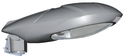
Mastaufsatz 60-76'er Zopf b-lite® kompakt 600